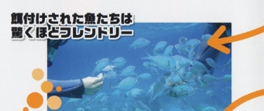
5 餌付けされた魚たちは驚くほどレジドリー 手に餌を持って海中にさし出すと、カラフルな熱帯魚たちが寄ってきます。