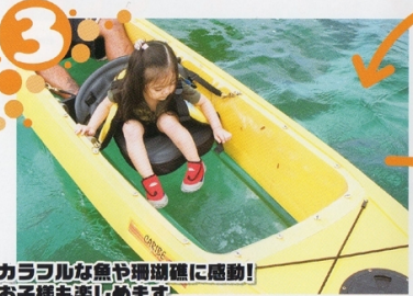
3 カラフルな魚や珊瑚礁に感動！お子様も楽しめます 子供や泳げない人でも安心して楽しめるのがクリアーカヤックの魅力。クリアー板越しに見える魚に子供も大喜び。