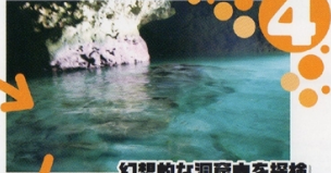
4 幻想的な洞窟内を探検 自然のダイナミックさに感動しながら、洞穴を歩いていくと、洞窟に到着。神秘的な光景に感動です。