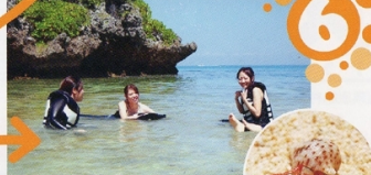
6 ヤドカリ島のビーチでブレイクタイム ヤドカリ島のビーチで休憩タイム。日光浴やシュノーケルなど自由にお楽しみ下さい。