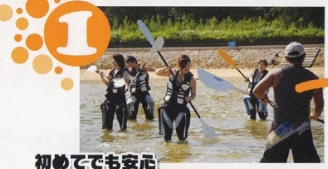
1 初めてでも安心 出発前には浅瀬で簡単なレクチャーを。パドルは肩幅間隔に持ち、ひじを曲げて漕ぐのがポイント。