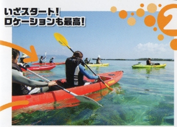
2 いざスタート！ロケーションも最高！ 海の上をすべるように進む爽快感はもちろん、海上から海中が見れる喜びはクリアーカヤックならではの。