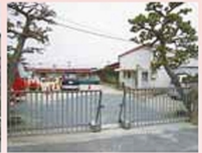
■信光幼稚園…約120m(徒歩約2分)