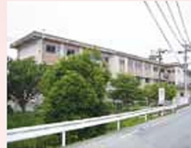
■西与賀小学校…約600m(徒歩約8分)