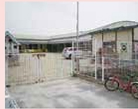
■城西保育園…約650m(徒歩約8分)