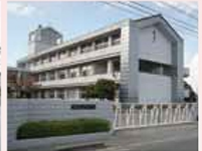
■城西中学校…約1,900m(徒歩約24分)