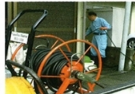
高圧洗浄機にて排水パイプ内清掃中

↓ 排水管に付着した油脂肪・汚でい等を高圧洗浄機を使用して取り除き、管洗浄をする。