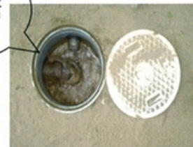
台所ため枡清掃前