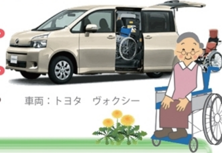
車両：トヨタ ヴォクシー

あなたの足としてお気軽にご利用ください。 ”おもてなしの心”で対応させていただきます。