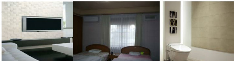
吸湿性認定品 エコカラット 天井、壁 珪藻土仕上げ 壁一部エコカラット 天井、壁珪藻土仕上げ 壁一部エコカラット