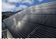
リクシルエナジー リクシルソーラー

モジュールは、サンテックパワージャパン株式会社製で世界中で一番普及しています。 モジュール出力25年保証 太陽光発電システム周辺機器 10年保証 サンテックパワー総合保障制度 自然災害、屋根漏水 10年保障 火災の場合は、お客様の火災保険等でその損害が支払われる場合、その保険等が優先されます。 地震、火山、津波による損害は補償の対象外です。