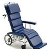
リクライニング型 車いす