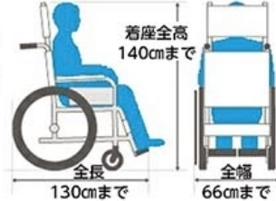
乗車可能な車いすのサイズ 着座全高 140cmまで 全長 130cmまで 全幅 66cmまで