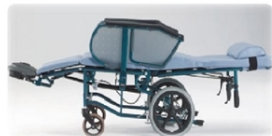
フルクライニング式車いす (有料) 1乗車-2,000円

当社のドライバーは、 介護施設の実務経験と知識・患者等搬送乗務員資格を活かしつつ 、又、普通自動車2種免許を所持し、運転のプロとしても安全運転で『安心感』『責任感』を持って、ご利用者様のお世話を行い、出発地～目的地までご乗車して頂ける『便利な』介護タクシーです。私達は… 親切・丁寧・安心・安全・快適・便利 をモットーに!! 私達が『心からサポート』します。ご安心して、お気軽にご利用ください。