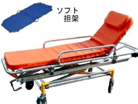
昇降式ストレッチャー (有料) (担架取り外し型) 1乗車-3,000円