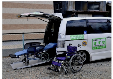
ヴォクシー Z煌 スローパー

病院内の介助やその他の介助にも対応!! ヘルパー有資格者の女性スタッフ付添いも対応が可能です