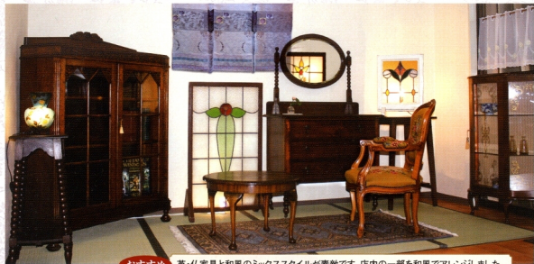
おすすめ 英・仏家具と和風のミックススタイルが素敵です。店内の一部を和風でアレンジしました。

【彫刻キセピネット】 彫刻が美しい、材質が美しい、色合いが美しい、サイズが大きい、デザインが美しい、非常に高価な家具です。この家具は、彫刻が美しい、材質が美しい、色合いが美しい、サイズが大きい、デザインが美しい、非常に高価な家具です。