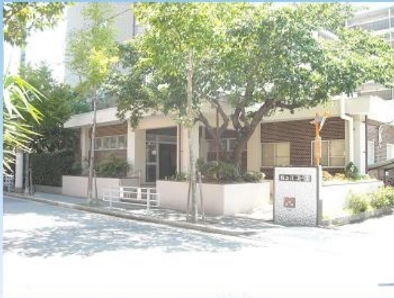
マンションエントランス外観