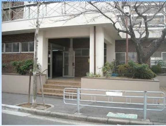
マンションエントランス外観