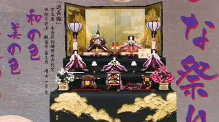
「運衣職」 本巻刺繍純絹奉仕 伝統工芸士 眼黒亭 富久作 横山一彦作 YO-063 開口150×奥行116×高さ130cm 558,000円