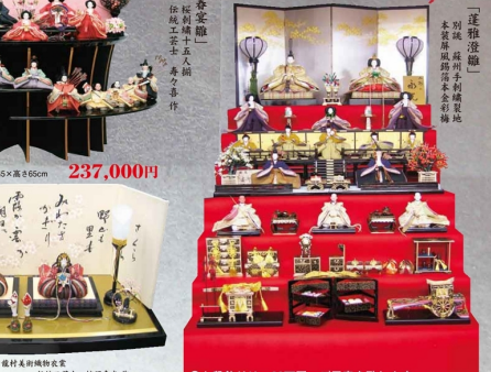
「香笠職」 別荘 藤州手刺繍製地 本巻刺繍純絹奉仕 職匠 秘蔵作 YO-062 開口150×奥行116×高さ130cm 558,000円