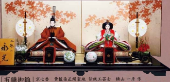
「有職御職」 京七番 貴織染正絹製地 伝統工芸士 横山一彦作 YO-273 開口120×奥行160×高さ55cm 336,000円