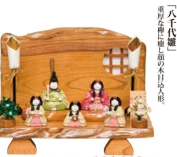
「御衣職」 別荘 藤州手刺繍製地 本巻刺繍純絹奉仕 職匠 秘蔵作 開口45×奥行31×高さ33cm 114,000円