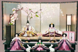
「綺祥職」 京八番 金彩奉皮裨十二早 職匠 秘蔵作 AM-124 開口105×奥行160×高さ72cm 315,000円

美人形がくる いろいろかるた 新日本様式であそぶ 暮らしの中に四季の移りか ぎけはなるに年をとりぬるの こぼれでなくしつたいた いのりかきた 美人形はなるにこぼれか す作事と現代アーティストによる 新解釈をかけて、あそびの文化を あそびに活かしました。