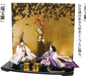
「御衣職」 別荘 藤州手刺繍製地 本巻刺繍純絹奉仕 職匠 秘蔵作 開口145×奥行40×高さ60cm 160,000円