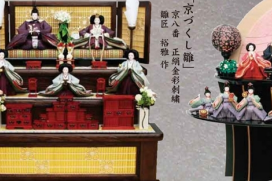
「京七くし職」 京八番 正絹金彩刺繍 職匠 秘蔵作 AM-185 開口80×奥行73×高さ80cm 253,000円