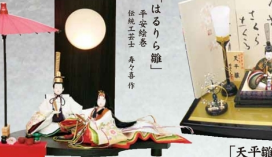
「はるりら職」 手戻職作 職匠 秘蔵作 SN-303 開口85×奥行45×高さ66cm 237,000円