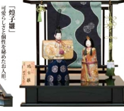
「御衣職」 別荘 藤州手刺繍製地 本巻刺繍純絹奉仕 職匠 秘蔵作 開口180×奥行37×高さ54cm 205,000円