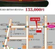
「御衣職」 別荘 藤州手刺繍製地 本巻刺繍純絹奉仕 職匠 秘蔵作 開口185×奥行54×高さ93cm 133,000円