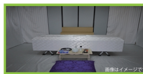
お通夜・告別式を行わず、火葬を行う基本的なプランです。