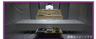
お通夜から葬儀・火葬までを執り行う代表的なプランです。