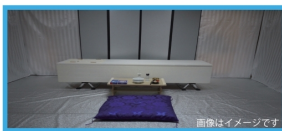
お通夜・告別式を行わず、必要最低限の物を揃えたシンプルなプランです。