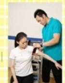
④片腕にベルトを巻きます