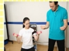
⑤簡単な運動で加圧を体感