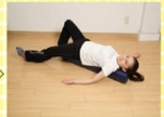
③着替えたらストレッチ