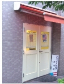
ラ・ガーディア事務所入口

楽しい先生たちと英会話を上達させたいあなた！今すぐ、ラ・ガーディア英会話スクールへ。まずは授業説明会にお越し下さい。英語の勉強は苦手！でも英会話は話したい！そんな方々のニーズにあったスタイル・