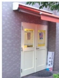
ラ・ガーディア事務所入口

楽しい先生たちと英会話を上達させたいあなた！今すぐ、ラ・ガーディア英会話スクールへ。まずは授業説明会にお越し下さい。英語の勉強は苦手！でも英会話は話したい！そんな方々のニーズにあったスタイル・