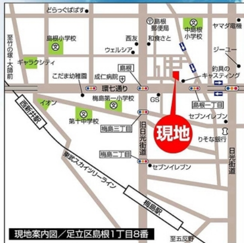
現地案内図/足立区島根1丁目8番