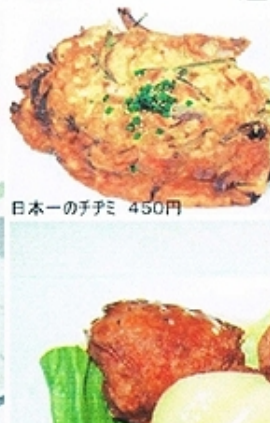
日本一の子チミ 450円