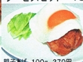
親子あげ 100g 270円