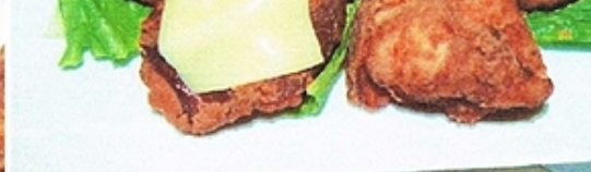
サービスセット 480円 ももx2 塩ダレ カレ ピリ辛 計5個