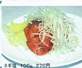
ネギ塩 100g 270円