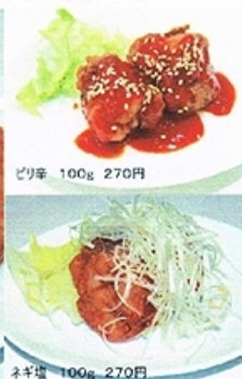
ピリ辛 100g 270円