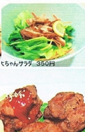
大ちゃんサラダ 350円