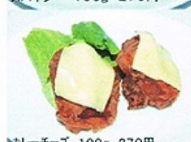
カレーチーズ 100g 270円