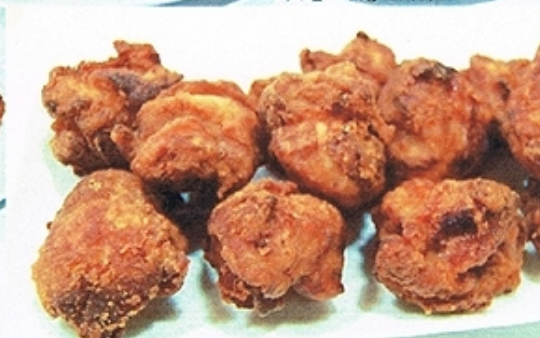
ファミリーセット もも12個入り 980円