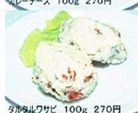
タルタルワサビ 100g 270円

江東区大島1-33-6 奥村ビル1階 03-3682-0805 http://www.d-karaage.jp 午前11時から午後10時まで営業