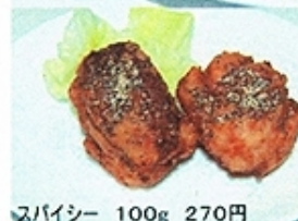
スパイシー 100g 270円