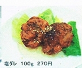
塩ダレ 100g 270円