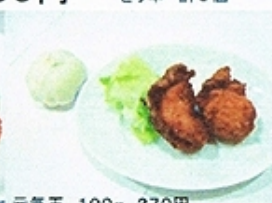
元気玉 100g 270円