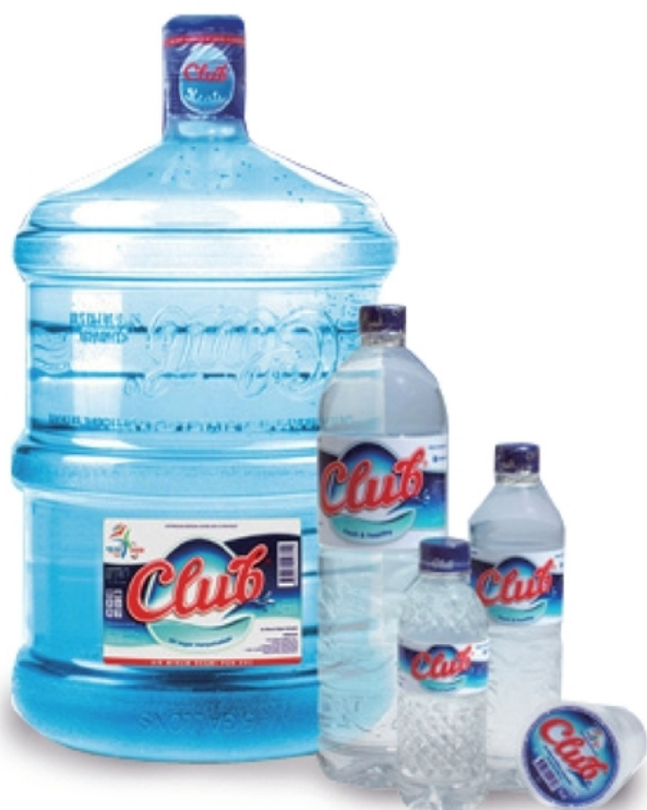
※画像はイメージで、実際の商品とは異なる場合があります

バリ島は、東南アジアのインドネシア共和国に属する島で、首都ジャカルタのあるジャワ島のすぐ東側に位置する島です。特にクラブウォーターの採水地であるバリ州南西部では、緑にあふれる土地になっています。クラブウォーターは、そのバリの雄大な自然の地下150メートルから汲み上げた天然のミネラルウォーターを最新鋭の機器にて不純物を濾過してボトルングしてお届けしております。