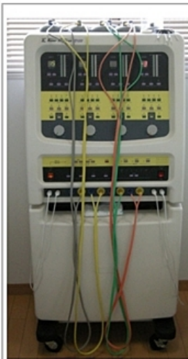
(スーパーテクトロン)

基礎代謝がアップするまでの最初の10回程度は週に2~3回、その後は週1回程度で無理なく継続させる事をおすすめします。