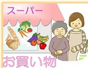
スーパー お買い物